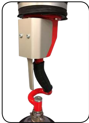
Enhåndsbetjent vakuumsugehoved Model UNO - Meget præcis håndtering - Blødere arbejdsgang for operatøren - Mindre støj