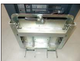
Fikseringsplade til stabler

Fikseringsplade med gaffer, når samme enhed skal anvendes til både stabler og gaffeltruck.