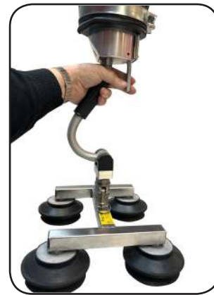
Enhåndsbetjent vakuumsugehoved Model UNO 90° Rustfri - Meget præcis håndtering - Blødere arbejdsgang for operatøren - Mindre støj